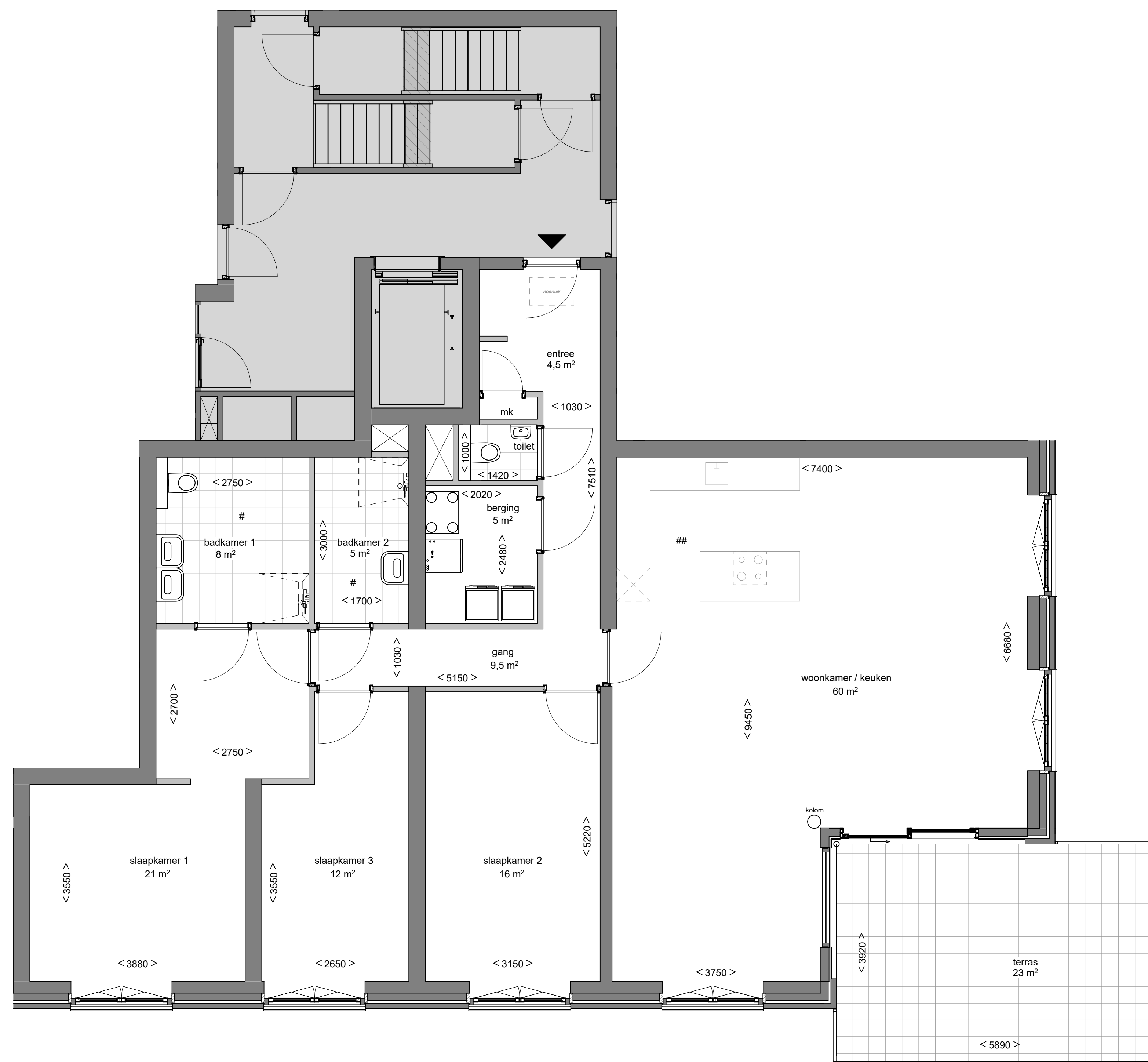
BEGANE GROND 1 : 50