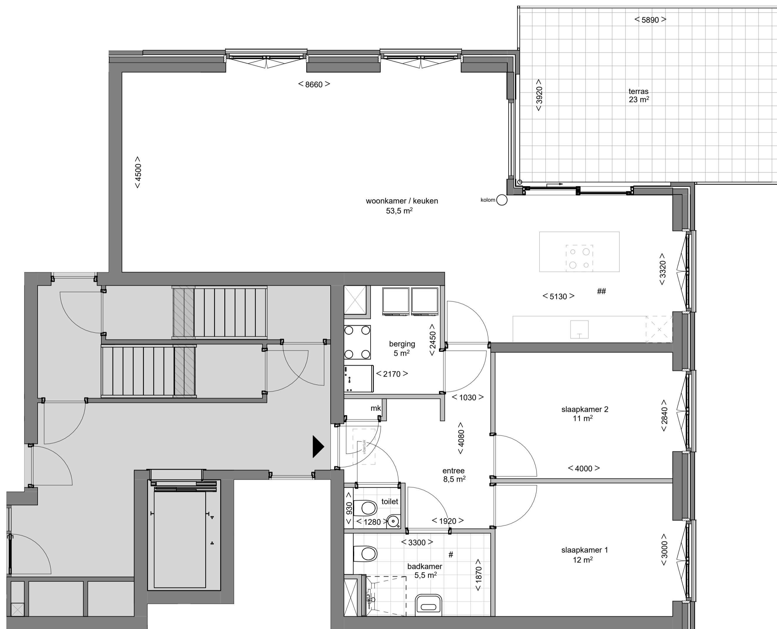
BEGANE GROND 1 : 50